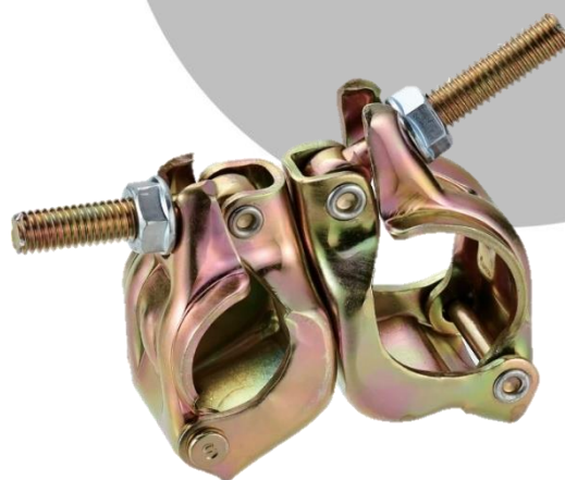
32-37×兼用クランプ自在 MJ-3