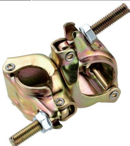
32-37×兼用クランプ直交 MJ-1