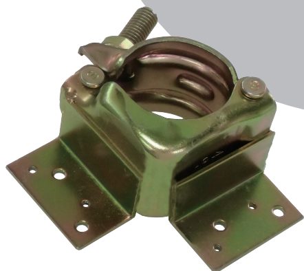
タル木止めクランプコーナー