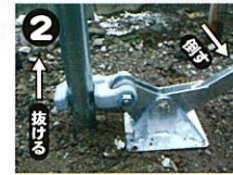
手前に倒すと杭が抜けます。