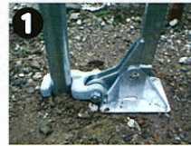
杭抜きをパイプにセット。