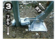
戻すと金具が下がります。